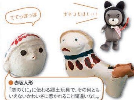
●赤坂人形 「恋のくに」に伝わる郷土玩具で、その何ともいえないかわいさに惹かれること間違いなし。