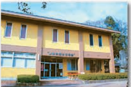
【筑後市郷土資料館】