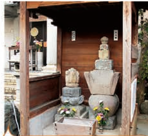
●羽犬の塚 約400年前、羽犬を弔うために秀吉がつくったとされる塚が今も残っています。

その昔、天下統一を果たした豊臣秀吉とも縁のある羽犬伝説が地名になったといわれる、歴史情緒あふれるエリア。「恋のくに」でとれるイチゴやナシをはじめとするおいしい特産品やかわいらしい赤坂人形など、おみやげを探すのにもバッチリ。