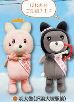
●羽犬像(JR羽犬塚駅前)