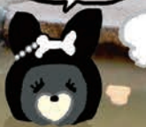
●川の駅船小屋 恋はまる(温泉館)